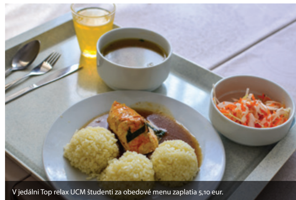
V jedálni Top relax UCM študenti za obedové menu zaplatia 5,10 eur.

Autorka: Lucia Bakusová