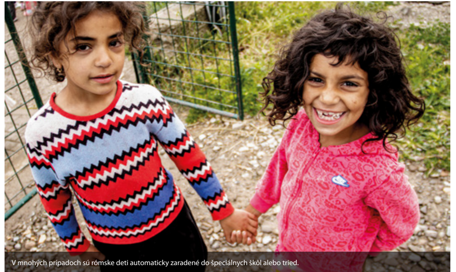
V mnohých prípadoch sú rómske deti automaticky zaradené do špeciálnych škôl alebo tried.

V súčasnosti vznikajú rómske triedy práve na základe rozhodnutia rodičov detí z majority, ktorí si neprajú, aby súčasťou triedy, ktorú navštevuje ich dieťa, boli rómski spolužiaci a spolužiačky.